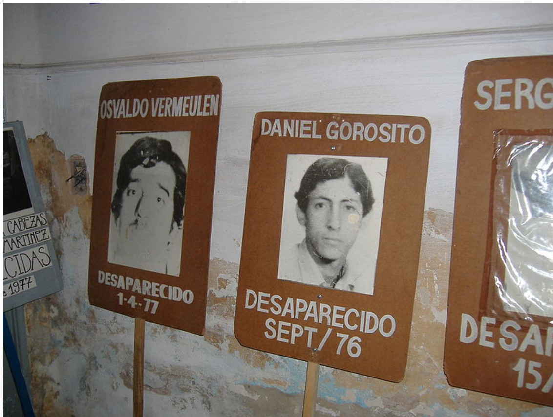
Figura 3. Desaparecidos en Rosario. Fotografía por Pablo Flores, 2006. Licencia Creative Commons CC-BY-SA 2.5, vía Wikimedia Commons.

permite hablar de la segunda forma de exposición descrita por Didi-Huberman (2014) que es la del encuadre de detalle. Este encuadre, usualmente presentado en formato cuadrado, muestra «el conflicto intrínseco de la humanidad como residuo, pero también como fuerza —aunque sea en vías de agotarse— de resistencia» (Didi-Huberman, 2014, p. 37).